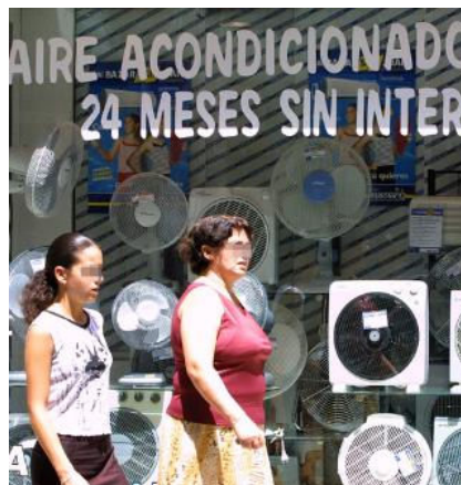
Morosidad. Los pagos a plazos, cada vez más difíciles. G. Torres

Así, los efectos impagados el pasado mes de marzo -último dato del que dispone el INE- generaron más de 3 millones de euros en comisiones de devolución, "un dinero salido de los bolsillos de empresarios malagueños". Hace sólo un año esta cantidad apenas superaba el millón de euros. Con una sencilla operación matemática se concluye que si los 102.000 efectos en gestión de cobro mencionados no se pagaran, el global ingresado por bancos y cajas de ahorro en concepto de comisión ascendería a 32 millones de euros en un mes. Málaga es la tercera provincia andaluza en esta clasificación, sólo por detrás de Huelva y Almería.