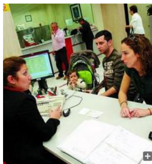
Una pareja conversa con una empleada de banca en Málaga.

La típica estampa del empresario o particular que, después de mucho sufrimiento, consigue que le den un cheque o un pagaré y, cuando acude al banco a cobrarlo, resulta que no tiene fondos es cada vez más habitual en Málaga. En marzo de este año, el número de efectos de comercio impagados (letras de cambio, cheques, pagarés o hasta recibos) ascendió en la provincia a 6.915, lo que supuso un incremento del 43% en relación con el mismo mes del año anterior, según los datos del Instituto Nacional de Estadística (INE). Si se atiende al importe de esos impagos, el aumento ha sido aún más llamativo, pues se ha pasado de 17,6 millones de euros en marzo de 2007 a 51,5 millones de euros en marzo de 2008, es decir, un incremento del 192%, casi el triple que hace un año.